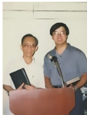
1989年8月 與林獻羔牧師合照