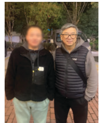
2023年11月 與安徽一位牧者合照