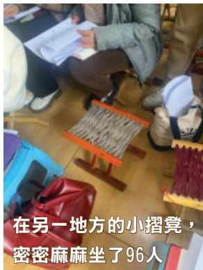
在另一地方的小摺凳， 密密麻麻坐了96人

每一堂的教導，他們有大綱，他們也有錄音。這次合共有100多頁的大綱，近500頁的講義，全都講了。他們把大綱和錄音帶回他們所在的地方，他們會重溫，會重聽，會給不能來的同工聽，也會在他們的教會中講。有一位牧者告訴我，他們所在的地方，便有100多間教會，另一位牧者告訴我，他們有500-600間教會。