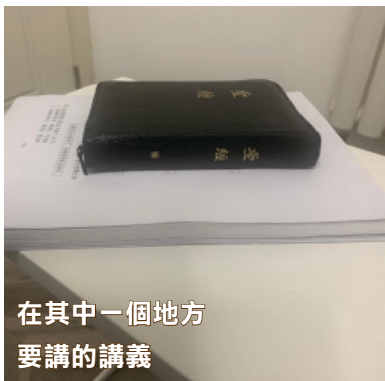
在其中一個地方 要講的講義