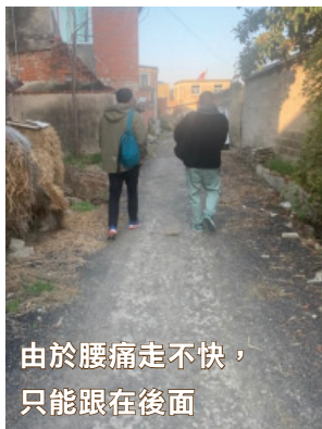
由於腰痛走不快， 只能跟在後面

在矮矮的摺凳上，他們的眼神告訴我：“我們可以，你只管講，我們要聽，我們會用心聽！”此情此景，我很難不忘我，我問他們可不可以，但沒有問我自己可不可以！