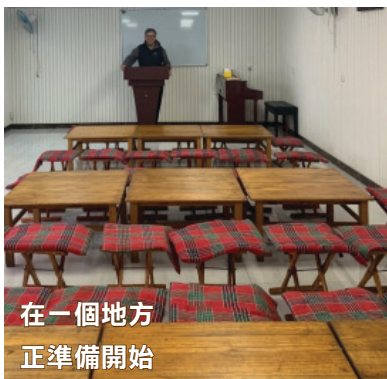
在一個地方 正準備開始