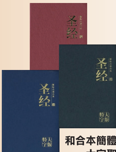
和合本簡體版 大字聖經