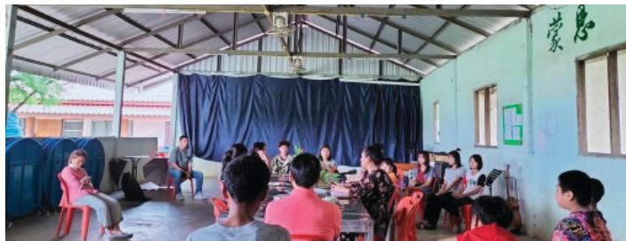
熊傳道服事的教會聚會情況

語還是片面的認識，加上當時有一位好朋友被異端東方閃電擄去，讓我深深體會到學習神話語的重要性。認識「空神」是上帝給我的恩典，我教會的牧師和師母都很支持我學習，希望藉著「空神」的學習更好的得到裝備，被主使用。”