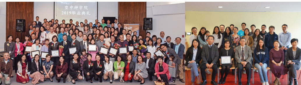
2019加拿大空中神學院畢業禮

如果你願意接受裝備以致可以更有有效的服事主，歡迎報讀「空神」。你可以登入網址 http://www.kzsxy.org/ 下載報名表，瞭解報讀資格，填妥報名表後，連同一份1000字內的個人得救見證（包括信主過程、信仰內容、以及在信主後的重要改變）電郵至「空神」教務處（ sota@twr.ca ）。