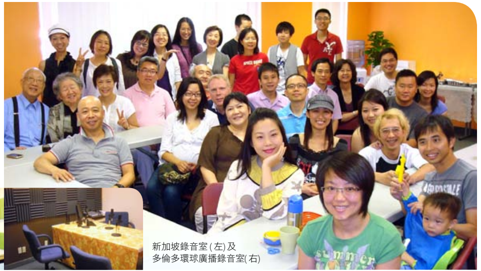
新加坡錄音室(左)及多倫多環球廣播錄音室(右)