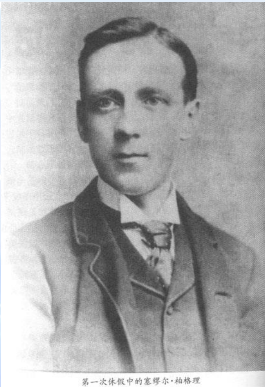
第一次休假中的塞缪尔·柏格理