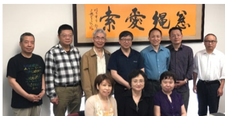
其中一個講道團契

講道團契是在2016年開始，至今已超過三年，參加的人數也近30人之多。由於要有效地學習講道，人數不能太多，因此目前分為三個團契：提摩太團，忠僕團與新心團。講道團契是每月一次聚會，每次都會有一至兩位負責講道。在團契前，講的人都要先把講章發給環球，批改後會發回，以便在團契前可以修改。團契結束後，同工會把有評語的講章發給各人，讓他們可以從講章的評語中學習。在每一次講道團契中之講道後，大家也會一起評論，讓大家對講道可以有進一步的認識與體會。