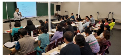
溫哥華的小組查經訓練

料都會加上評語後發回給學員，讓學員可以根據評語作出修改。如此來回兩三次後，學員會更深地體會如何準備查經材料。同時，所有學員又會收到其他學員之作業，可以幫助他們有進一步的學習。每一次批改一份作業都需時2-3小時，一點也不輕鬆，但果效卻是明顯的。