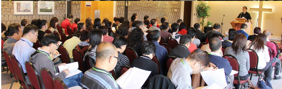
2015 溫哥華讀經營(上)，2015 多倫多查經營(下)