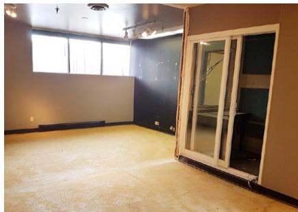
裝修中之錄音錄影室

與裝置。錄音室會分別有單人錄音與小組錄音的地方，小組錄音之地方日後更可以作錄影之用，可以說是一地二用。美國環球會派專人前來協助這錄音錄影室之建造，務求有最好之設施，可以長遠使用。