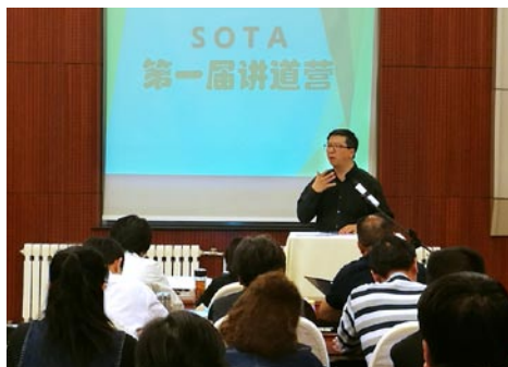
第一屆中國講道營

請為講道之服侍禱告，也為環球在講道上的培訓代禱，以至可以幫助那些願意學習，願意改變的教牧同工，使他們可以更有力地宣講神的話，讓神的講臺，可以得到它應有的尊榮。