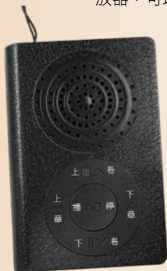
2014 第一批聖經播放器