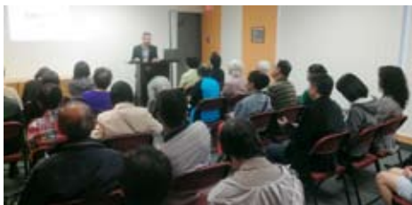
多倫多「空神」學生會