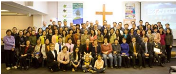
2016年加拿大「空神」畢業禮