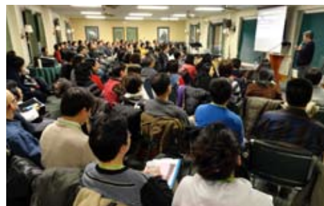
去年第一屆“讀經營”

除以上兩項活動，環球又與聖言中心合辦“讀經營”與“講道營”。讀經營是為培育信徒讀經，講道營是專為牧者而設，盼望牧者在講道營中一同學習，使各人在講道的服侍上可以更進一步。