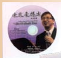
中國國內版 (為方便攜帶)