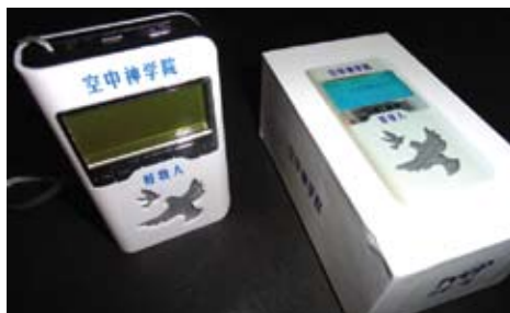
空中神學院課程播放器

為方便學生學習，我們現已完成“空神”播放器的製作，全套“空神”課程可以下載於播放器內。