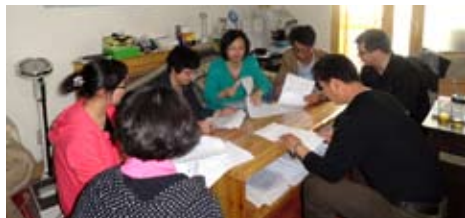
空中神學院同工會議