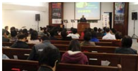
其中一次“環球釋經講道日”

除以上兩項活動，環球又與聖言中心合辦“讀經營”與“講道營”。讀經營是為培育信徒讀經，講道營是專為牧者而設，盼望牧者在講道營中一同學習，使各人在講道的服侍上可以更進一步。