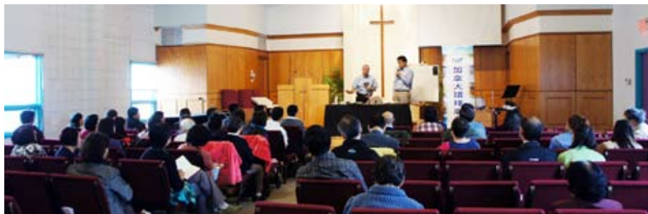
卡加利門徒訓練講座