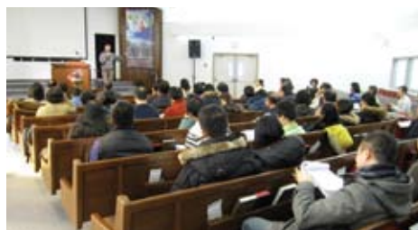
其中一次“環球門訓講座”

除空神外，環球在本地加拿大亦分別在四個城市合共舉辦12次門徒訓練講座，參加之信徒來自超過90間的教會，門訓講座主要針對信徒生活與事奉方面，今年之題目包括“時間管理學”、“教會動力學”、“個人佈道學”、“恩賜與事奉”、“聖經談道學”、“釋經與應用”、以及“七個屬靈的致命傷”。環球又於今年8月開始在多倫多舉辦釋經講道日，鼓勵信徒注重神的話語，每次之釋經講道日都會以一卷書為中心，除宣講書卷中之信息外，又會集結敬拜與禱告在信息與信息之間。今年宣講之書卷包括利未記、雅各書與使徒行傳。