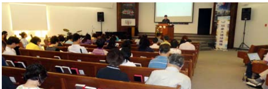
多倫多門徒訓練講座

環球廣播為建立教會，栽培信徒，自2011年9月始舉辦門徒訓練講座，過去曾舉辦之講座包括：聖經談道學、有效的小組查經、有效的佈道事工、正意解經法、有效的禱告、如何準備查經資料、中文代表字、追求像主、時間管理學、教會動力學、恩賜與事奉。且今年也開始在除了多倫多之外的加西三個城市(溫哥華、卡加利、愛民頓)舉辦門徒訓練講座，均受到許多弟兄姊妹的好評。