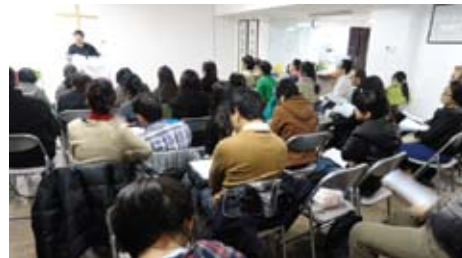
其中一個“空神”中心