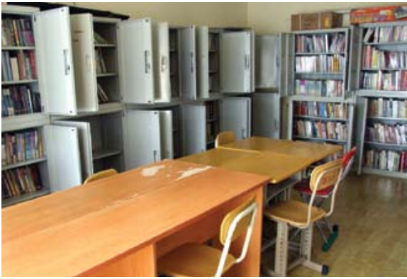
中國的一所神學培訓中心的圖書館

明白也要承認神學知識不等同人生閱歷，因此一方面要為這些同工這方面的需要代禱，另一方面也要鼓勵並協助他們在這方面的追求。