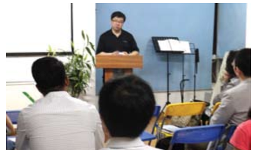
中國空中神學院學生會上分享信息

中國新一代的工人、海外新一代的教會，有值得感恩的地方，也有需要關注的地方。神的心意是信徒要成長、教會要增長。作為神的工人、主的教會，這大方向不能偏離，要克己向學，也要虛己共處。如此，工人的生命才可以更強，神的教會也可以更美。惟願新的一代能為中國教會歷史寫下更美的一頁，成為日後教會歷史中的佳話。